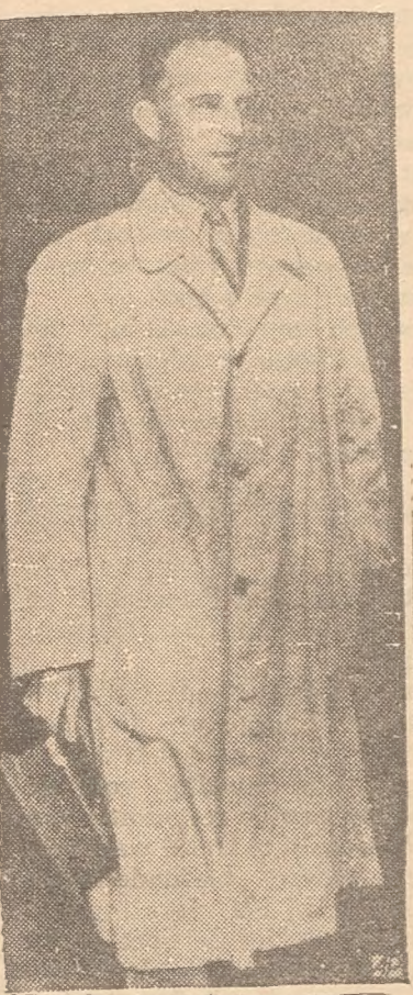
KONING LEOPOLD Zal hij aftreden ten gunste van zijn zoon Eoudevijn?

Er zijn in Paraguay nog steeds haarden van verzet en de mariniers van Paraguay verklaarden zich accoord met de opstandelingen in het Noorden (Paraguay, (P) 29.4).